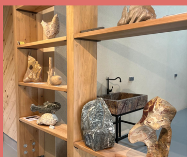
Taller de marmol en Ilhet

Todo esto favorecido por la necesaria y buena gestión de la comunicación vial a través del Túnel Bielsa-Aragnouet.