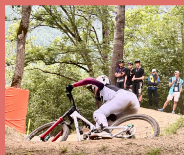
Copa mundo BTT Loudenvielle