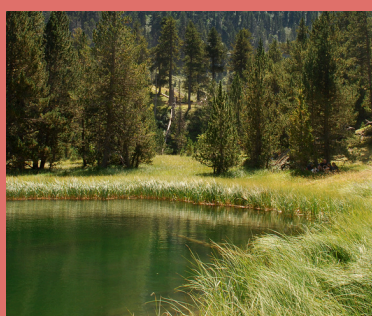
Ibón de Batisielles